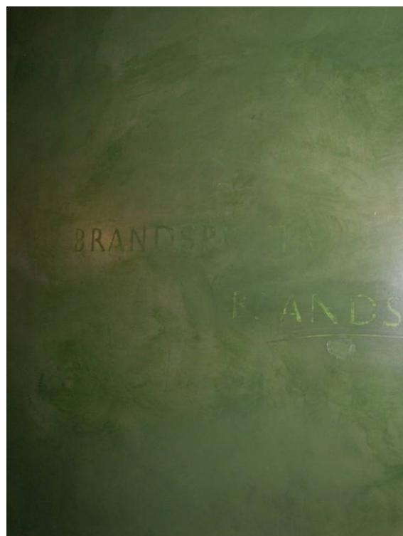
"Brandspruta" textat spår i stucco lustron, före och efter återställande.