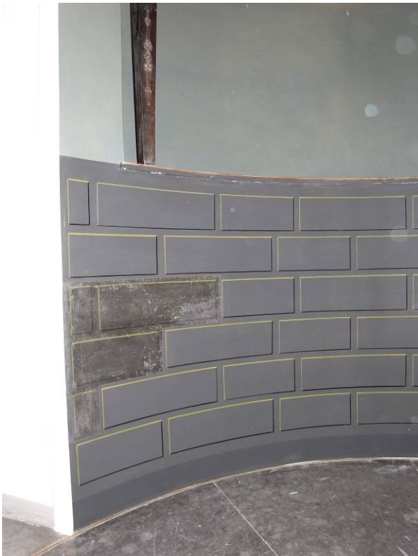
Kvadermönstret under arbete med originalet