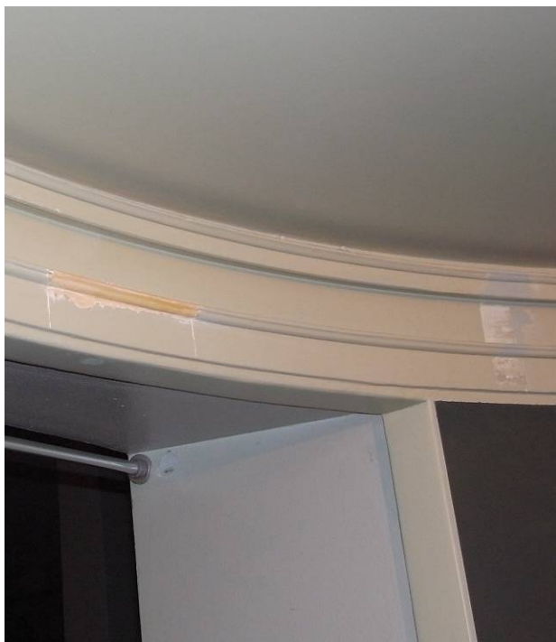
Provytor vid taklist. Förgyllda delar av listen har konstaterats