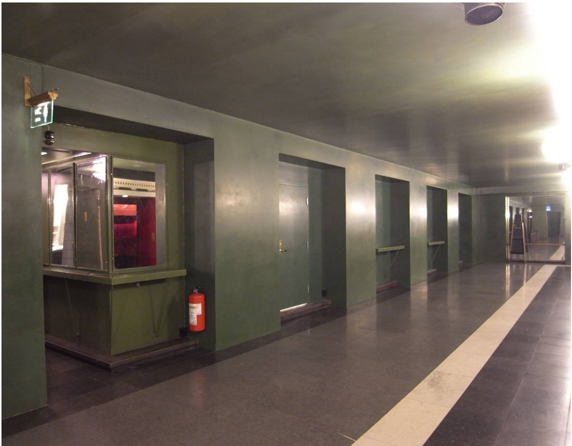
Nedre promenoiren invid toaletter, förråd och personalrum 2012. Väggtyor är återställda till originalskick