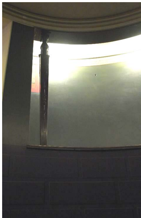
Ombyggnad av garderob har gjorts om till förråd med dörr. Nu har ytan målats och dörren maskerats genom borttagande av foder.