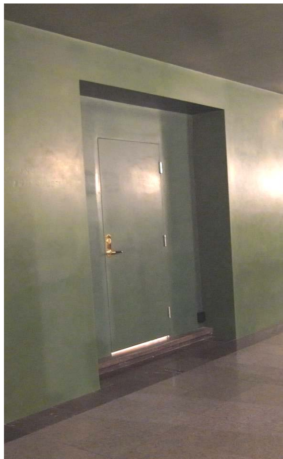
Ombyggnad av garderob under senare tid till förråd med dörr. Nu har ytan målats och dörren maskerats genom borttagande av foder.