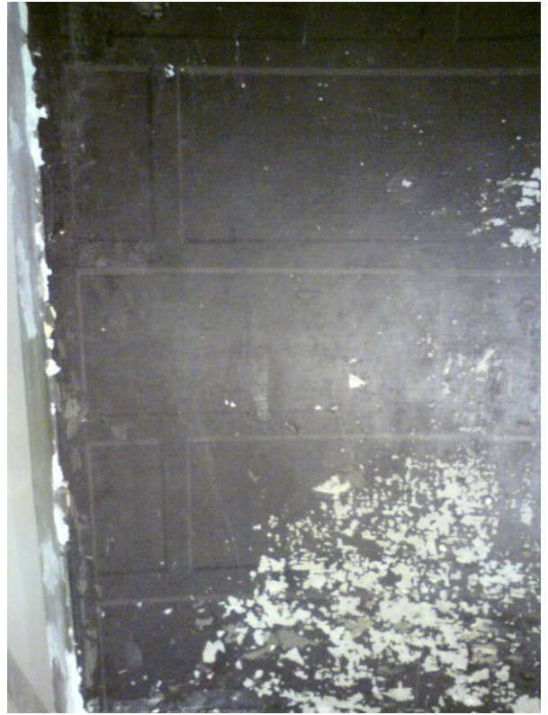
Originalytor invid öppningen