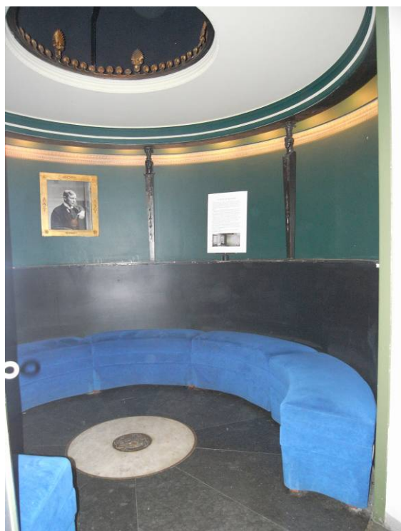
Före: Stjärnrummets inredning 2008 med en originaltavla hängande i fonden, med Gunnar Asplunds porträtt.