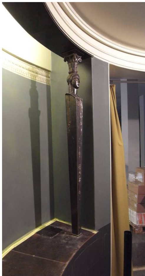
Stjärnrummet. Övre väggfältet taklist och tak återställt. Avsats och karyatid av mässing rengjorda, polerade och återpatinerade.