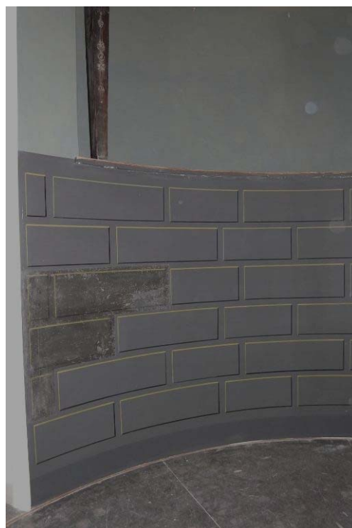
Efter: Stjärnrummets nedre väggyta med kvadermålning, originalprovyta och rekonstruerad del